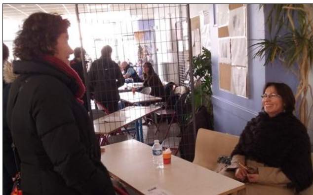
■ Le forum des métiers est destiné à éveiller des vocations, en organisant la rencontre des jeunes et des parents avec des professionnels du territoire.